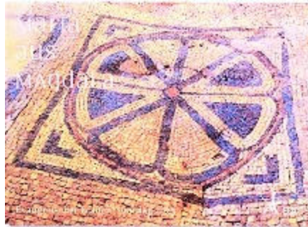
Achtblättrige Rosette auf dem Boden der Synagoge in Magdala, 1. Jhdt. n. Chr.